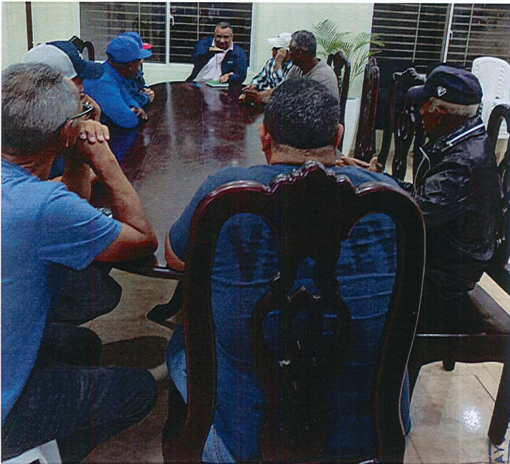
PARTICIPACION DE LOS PRESENTES